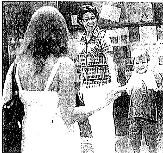
Les accueils périscolaires constituent un mode de garde très apprécié des familles et accessible à tous.

Les animateurs d'accueil périscolaire sont des médiateurs,